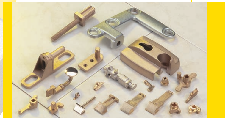
Ensemble d'accessoires pour menuiserie intérieure / extérieure

Les tolérances dimensionnelles serrées et constantes entraînent la réduction des usinages et une diminution du poids des pièces.