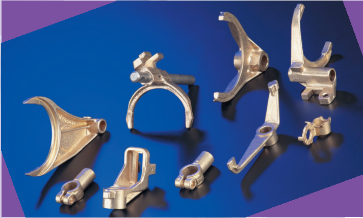
Ensemble de pièces du secteur automobile